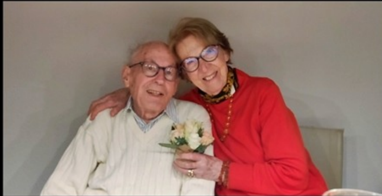
Geburtstagsparty 18. März 2023