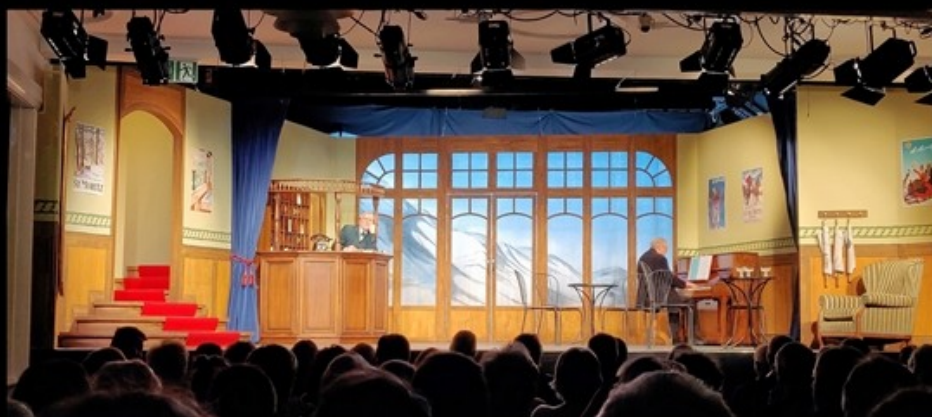
Theater in Uetikon Drei Männer im Schnee