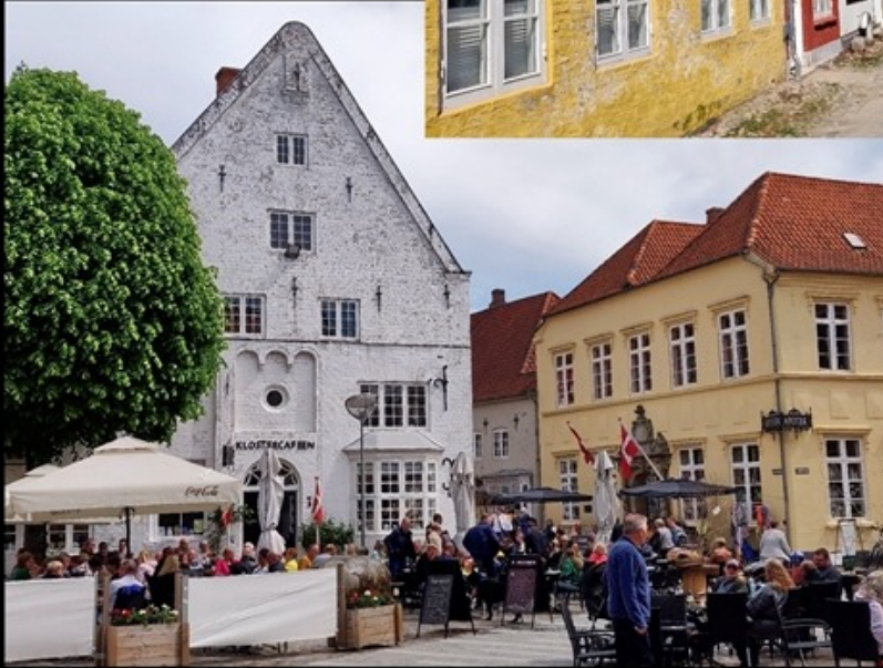
Ausflug nach Tønder (Dänemark)