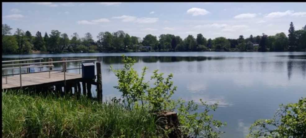
Fünf-Seenfahrt von Fegetasche nach Malente